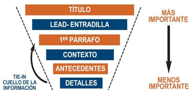
Figura 1: pirámide invertida